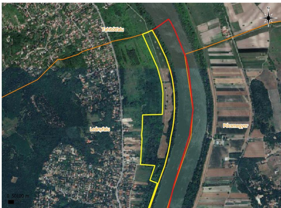
1. ábra A tervezési terület északi része.

A sárga határvonal a védelemre javasolt további területek (ld. még 1. sz. mellékletben az érintett földrészletek helyrajzi számait) határát jelzi.