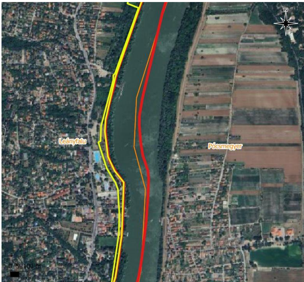
2. ábra A tervezési terület középső része I.