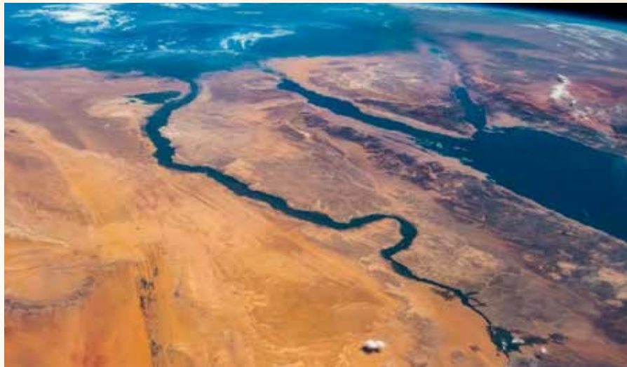
Műholdas felvétel a Nílus egyiptomi szakaszáról

Kérem, hogy utunk megvalósításához szükséges anyagi fedezet megszerzése érdekében segítséget nyújtani szíveskedjen! Vállalkozásunk részleteinek ismertetése tárgyában bármikor állok rendelkezésre egy személyes találkozó céljából!