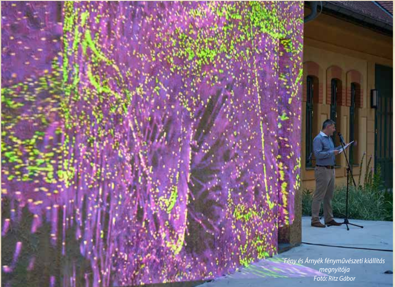
Fény és Árnyék fényművészeti kiállítás megnyitója