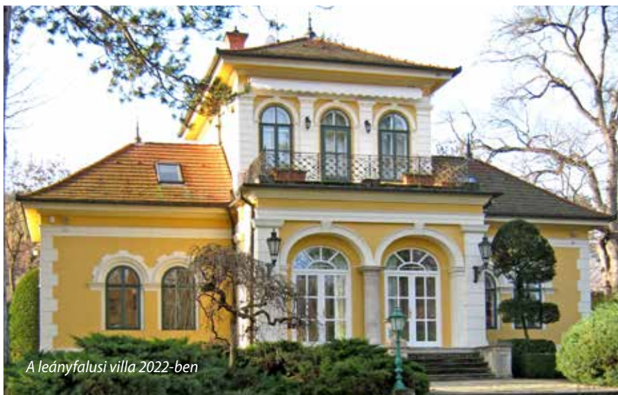
A leányfalusi villa 2022-ben