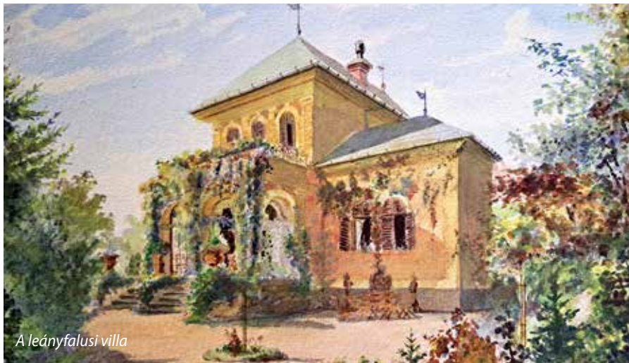
A leányfalusi villa